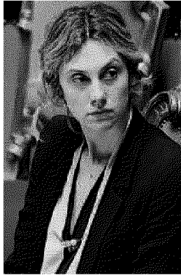
Il ministro della Pa Marianna Madia